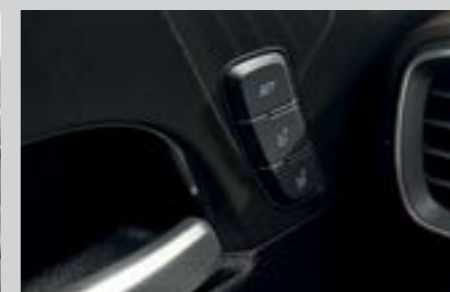
Nhớ ghế lái 2 vị trí