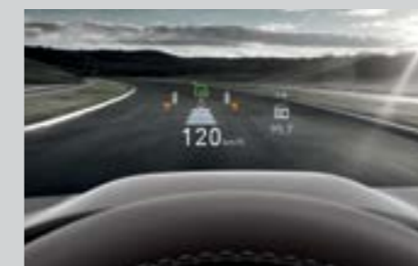
Hiển thị thông tin kính lái HUD