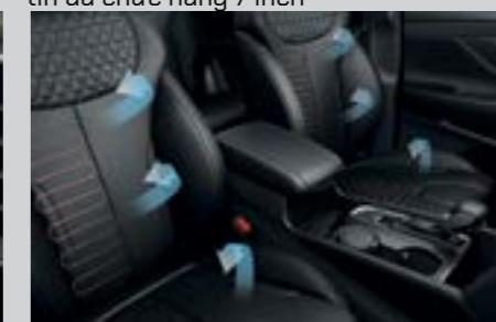
Sưởi và thông gió hàng ghế trước