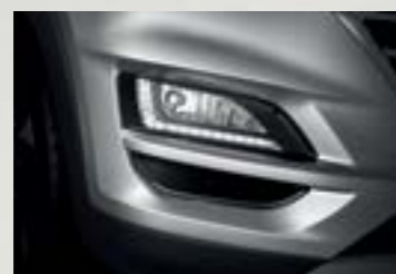
Dải đèn LED ban ngày sắc sảo