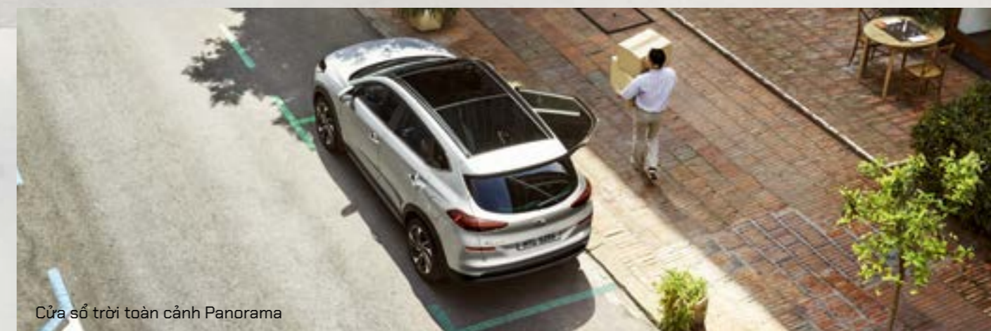
Cửa sổ trời toàn cảnh Panorama