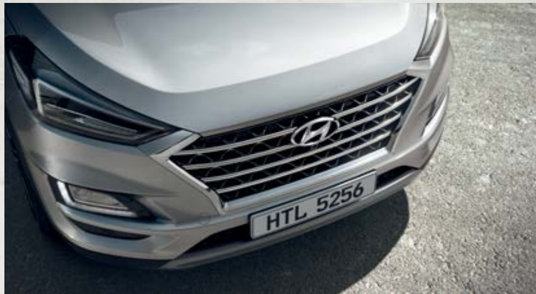
Lưới tản nhiệt dạng thác nước Cascading Grill ấn tượng