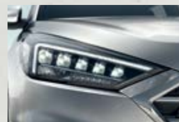
Cụm đèn pha Full LED mạnh mẽ